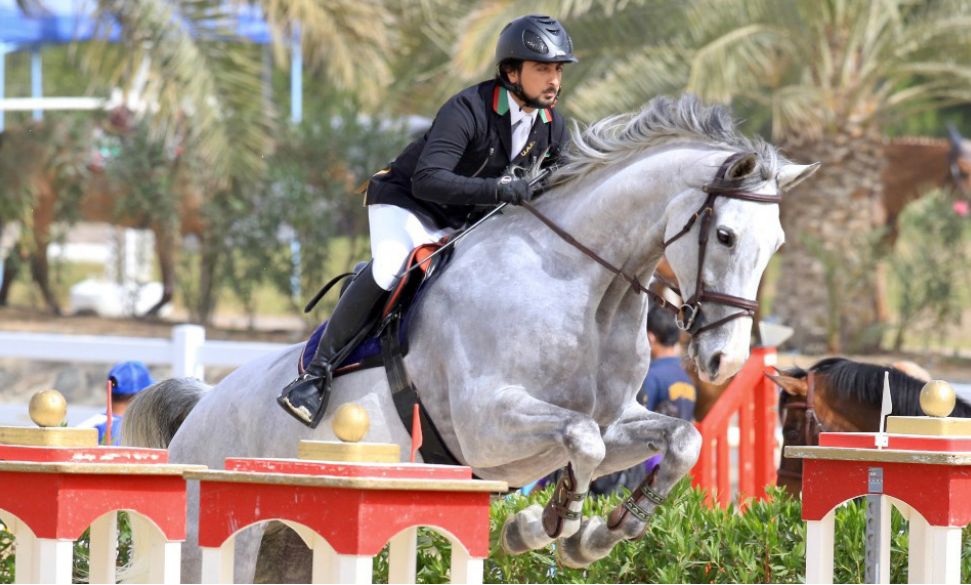
راشد آل مكتوم تفوق في الشوط المفتوح