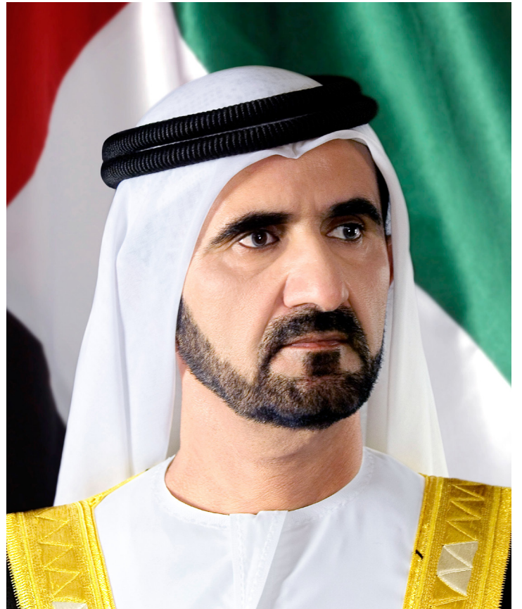
صاحب السمو الشيخ محمد بن راشد آل مكتوم، نائب رئيس الدولة رئيس مجلس الوزراء حاكم دبي، رعاه الله