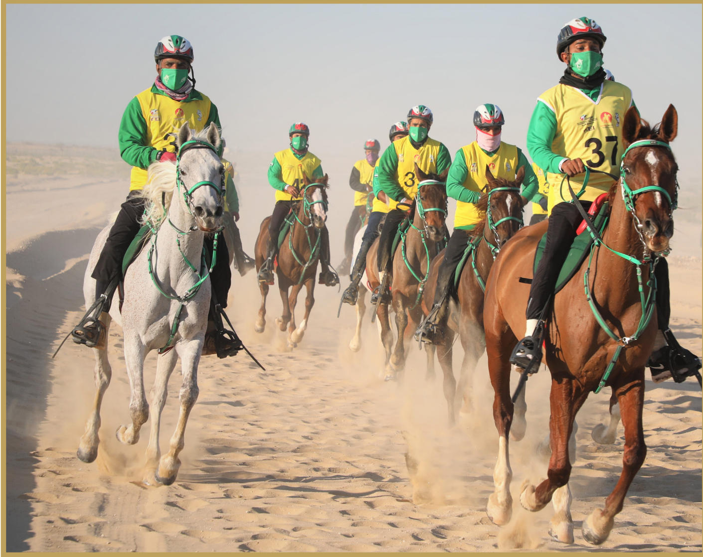
قرية بوذيب العالمية استضافت 8 سباقات تأهيلية خلال شهر يناير