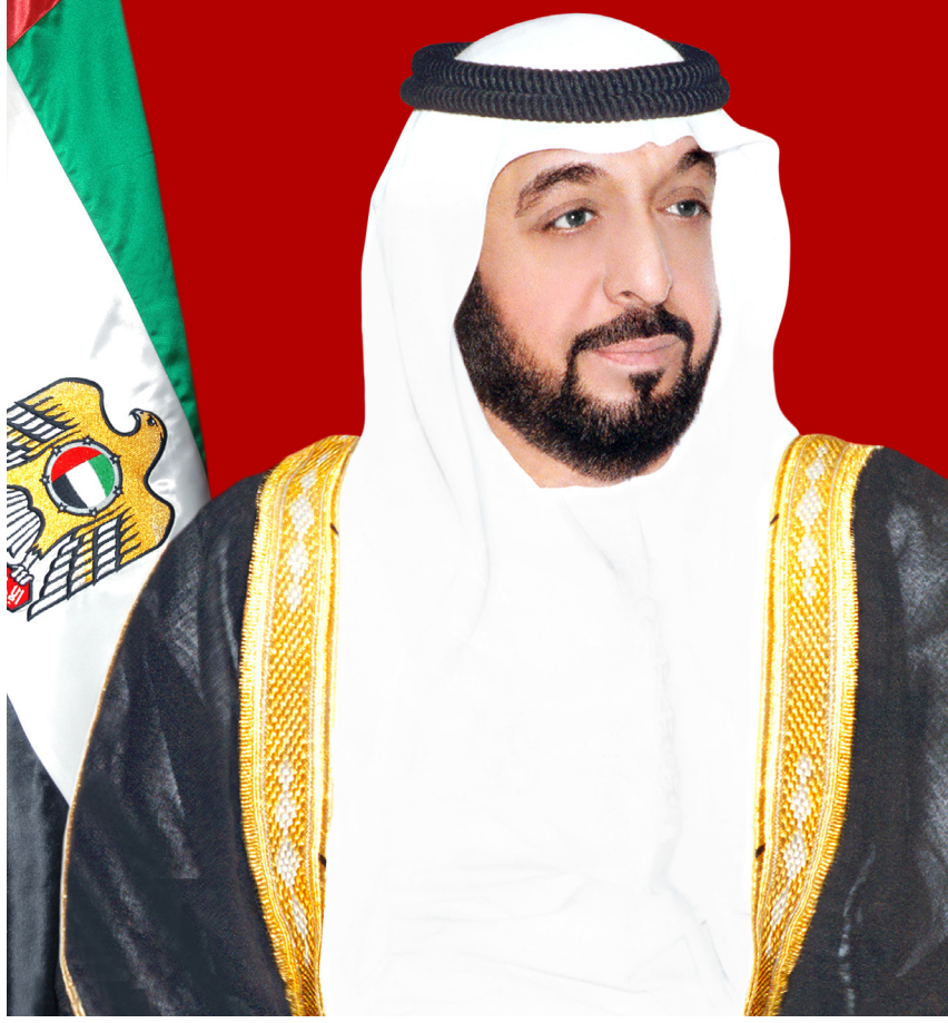
صاحب السمو الشيخ خليفة بن زايد آل نهيان، رئيس الدولة، حفظه الله