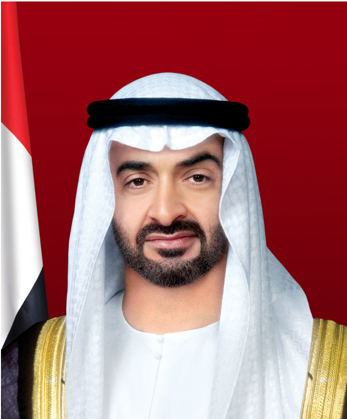
صاحب السمو الشيخ محمد بن زايد آل نهيان ولي عهد أبوظبي نائب القائد الأعلى للقوات المسلحة