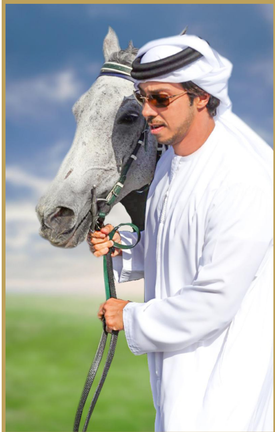
منصور بن زايد ودعم كبير لفروسية الإمارات