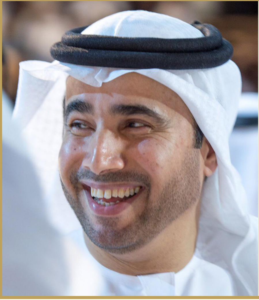
أحمد ناصر الريسي